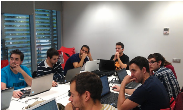
Taller Android (Reus)