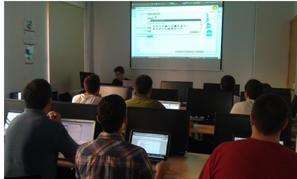
Taller Google Maps (Tarragona)