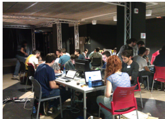
Hackathon Smartcity (Tarragona)