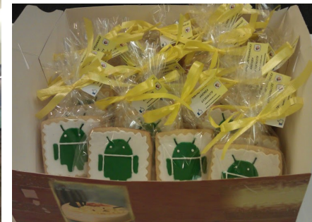
Web oficial Google I/O Extended 2012