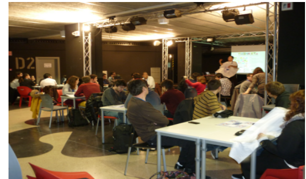
Hackathon Gamificació (Tarragona)