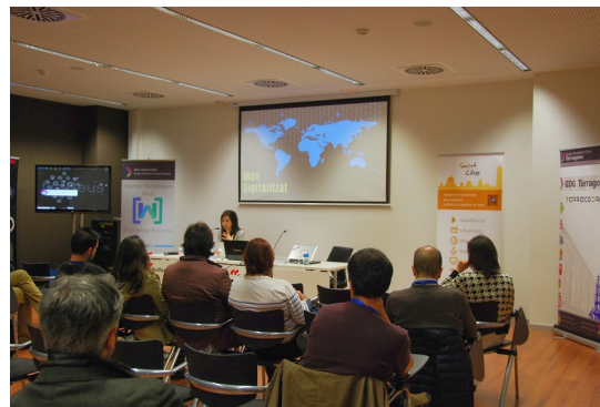
Women Techmakers (Reus)